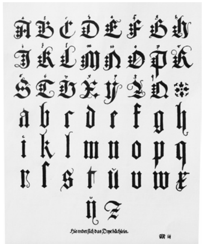
Página da Underweysung der Messung .

Curiosamente, até à data, nenhum typeface designer pôs no mercado tipográfico uma digitalização deste estudo de Dürer sobre as formas da Fraktur. O problema não pode ser a dificuldade de obter um scan e proceder à sua digitalização,