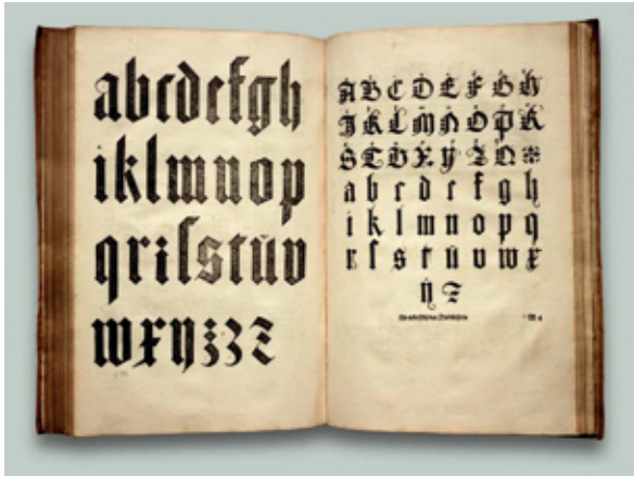
As minúsculas da Fraktur, na sua forma mais simplificada, sem ornamentos, salientando as formas geométricas. Em cima: o original de Durero. Em baixo: uma vectorização das mesmas letras.